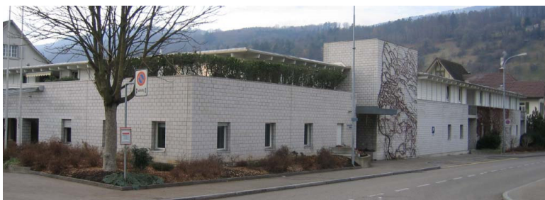
Das Alters- und Pflegeheim Sägematt im Zentrum von Lengnau

Die ältere Generation kann ihren Lebensabend im Alters- und Pflegeheim Sägematt verbringen. Das Alters- und Pflegeheim Sägematt ist zentral, nahe des Bahnhofs, gelegen. Es bietet Raum für 50 betagte oder pflegebedürftige Personen aus Lengnau und Umgebung. Seit 2005 gibt es eine Wohngruppe mit 12 Plätzen für Demenzerkrankte. Je nach Belegung sind auch Ferien- und Tagesaufenthalte möglich. Das Restaurant im Alters- und Pflegeheim Sägematt ist täglich geöffnet. Die Begegnungen im Restaurant, die permanenten Ausstellungen und weitere Aktivitäten ermöglichen den Pensionären, den ständigen Kontakt mit der übrigen Dorfbevölkerung zu pflegen.