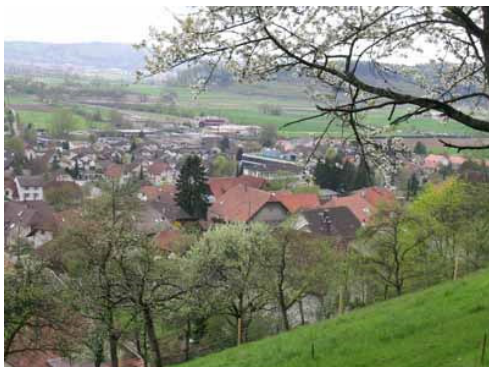
Das Dorf von Norden

Das Dorf präsentiert sich mit der neuen Begegnungszone in einem neuen Kleid und lädt die Bevölkerung zum Flanieren ein.