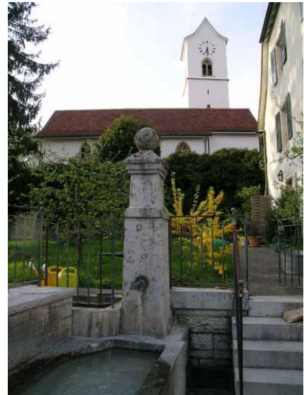
Die reformierte Kirche im alten Dorfkern

Vom Mittelalter bis 1798 grenzte Lengnau westlich an das Fürstbistum Basel. Dies führte häufig zu kämpferischen Auseinandersetzungen mit den Nachbarn. Trotz den Querelen und schweren Krisenzeiten, konnte sich das Dorf immer wieder erholen und behaupten.