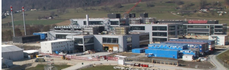
Der Neubau der CSL Behring Lengnau AG / Thermo Fisher Scientific Inc.

Im Jahr 2014 erhielt die Einwohnergemeinde Lengnau BE von über 45 geprüften Standorten auf der ganzen Welt den Zuschlag der CSL Behring Lengnau AG.