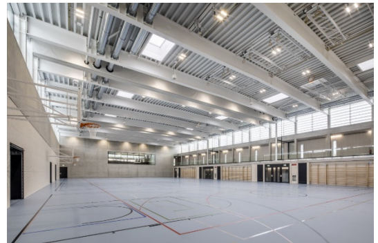
Die neue Dreifachsporthalle im Campus Dorf

Alljährlich wird im August das Lengnaufest (seit 2017) und im Dezember der Weihnachtsgarten durchgeführt.