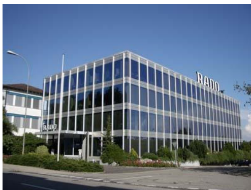
Rado Uhren AG

Die Einwohnergemeinde Lengnau BE ist ein interessanter Wirtschaftsstandort, wo zahlreiche Industriebetriebe zu finden sind.