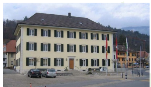
Das Gemeindehaus am Dorfplatz

Die Verwaltung ist im Gemeindehaus und einem Nebengebäude untergebracht. Seit dem 1. Januar 2004 ist sie nach einem Geschäftsleitermodell mit fünf Abteilungen (Präsidial-, Finanz-, Bau-, Sozial- und Schulabteilung) organisiert. Die Einwohnergemeinde Lengnau BE beschäftigt 50 Personen.